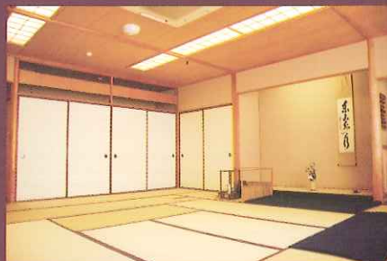
デイサービスの茶室